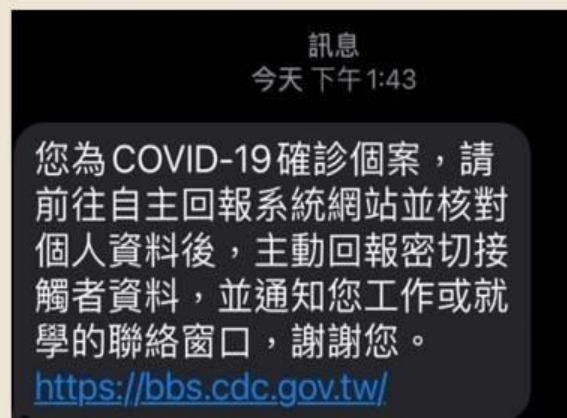
確診者收到簡訊之畫面