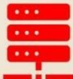
確診個案自主回報疫調系統